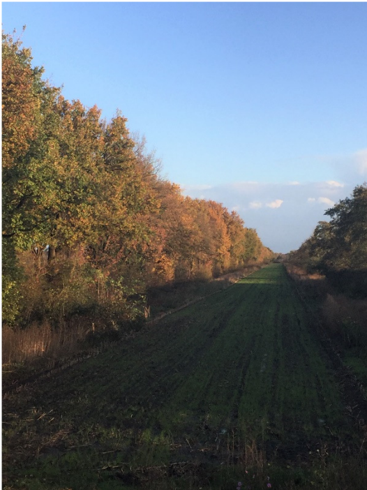
De oostzijde van het Prinsenlaantje, blik in de richting van Maartensdijk