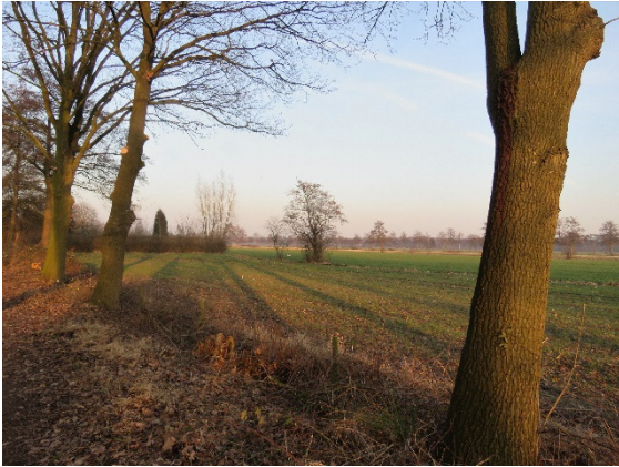
Blik vanaf het Prinsenlaantje in noordoostelijke richting

(die hierover gaat) hield in het verleden strak vast aan die contouren, om het landschap te beschermen, maar daar is begin dit jaar verandering in gekomen. Provinciale Staten hebben de regels om bouwgrenzen op te rekken, de rode contouren, in de kleine kernen versoepeld. De uitbreiding gaat om maximaal 50 huizen en onder bepaalde voorwaarden. "Het is aan de gemeente om hiervoor de noodzaak te onderbouwen en een locatie aan te dragen, aansluitend aan de kern", aldus gedeputeerde Huib van Essen.